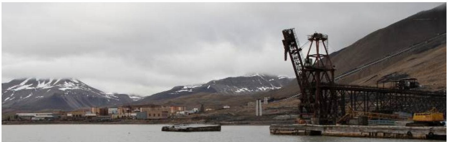
Foto 1: Zairon, https://commons.wikimedia.org/wiki/File:Pyramiden_Kulturzentrum_Kino_3.jpg | Foto 2, 3: Carsten Kolhschmidt | Foto 4: Bjoertvedt, https://commons.wikimedia.org/wiki/File:Pyramida_harbour_west_IMG_7312.JPG

Gern nehmen wir Anmeldungen für einen gemeinsamen Kinobesuch in dem verlassenen Kulturhaus in Pyramiden/Spitzbergen entgegen. Flüge dahin oder einer weniger klimaschädliche Schiffsreise lassen sich nach dem Ende der Coronapest sicher unkompliziert buchen. Mit Vergnügen spielten wir für einige Besucher dort eine Vorstellung, zumindest wäre die Idee den Versuch einer Umsetzung wert. Neben einem Ersatzfilm würden wir einen transportablen 35mm Projektor einpacken. Technik und Film liegen dort ja eigentlich schon bereit. Für die Reisekostenübernahme würden wir bei Omas, Onkels und Tanten nachfragen, unseren privaten Spaß also unbedingt ganz privat finanzieren. Zur Sicherung des Kinobetriebs freuen wir uns über Spenden und senden Ihnen gern die Kontonummer unseres Betreibervereins zu. Außerdem verkaufen wir Kinogutscheine ab einem frei wählbaren Betrag von 20,- Euro. Die Gutscheine gelten nur für Kinokarten und können auch schrittweise eingelöst werden.